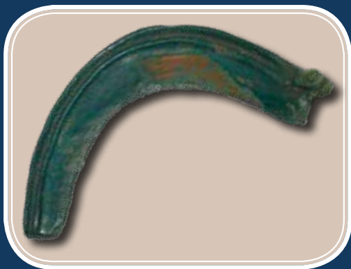
Késő bronzkori sarló Szilvásvár-Kelemenszékéről

A lelőhelyen nagyon sok ép és töredékes darab került elő a korszak háztartásainak egyik legfontosabb kellékéből, az őrlőkőből. A gabonafeldolgozásnak ez az alapvető eszköze könnyen felismerhető, mert jellegzetes cipő alakú, csiszolt felületű darabjaik nem a helyi kőzetekből készültek. Nagy számuk arról árulkodik, hogy a kelemenszéki településen sok gabonát tárolhattak és dolgoztak fel. Az itt élők háztartásaiban tárolt gabona valószínűleg a környező településekről került ide, hiszen a hegyoldalon nem tudták volna a helyieknek szükséges mennyiséget megtermelni.