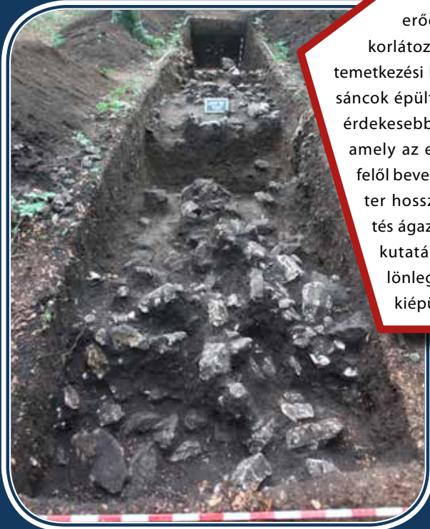
Az erődített település északnyugati sáncának átvágása 2018 nyarán

ga szerint valamilyen nagyobb tárgyra – akár egy bronz- edényre vagy egy sisakra – volt felerősítve.