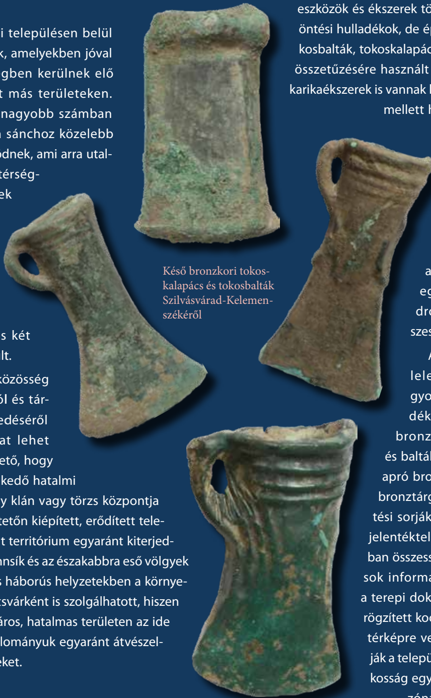
Késő bronzkori tokoskalapács és tokosbalták Szilvásvár-Kelemenszékéről

Az ELTE bronzkincs kutatócsoportja által végzett fémkeresés kutatás eredményeként eddig 620 régészeti korú fémtárgy került elő a szilvásvár-kelemenszéki lelőhelyen. A késő bronzkori tárgyak zömében