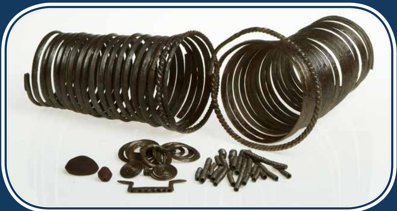
A Szilvásvár-Kelemenszéken előkerült 1. depó