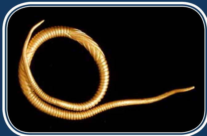
Arany hajkarika Szilvásvár-Kelemenszékéről

A lelőhelyen előkerült öntési hulladékok – pl. bronzöntecsek, öntőcsapok, nyersanyagtömbök – arra utalnak, hogy az itt élők nagy mennyiségű bronztárgyat készítettek.