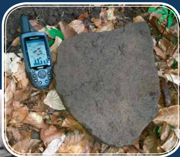
Őrlőkővek töredékei a lelőhelyről