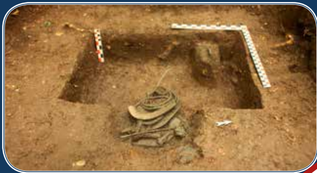
A 2. depó eredeti helyzetében