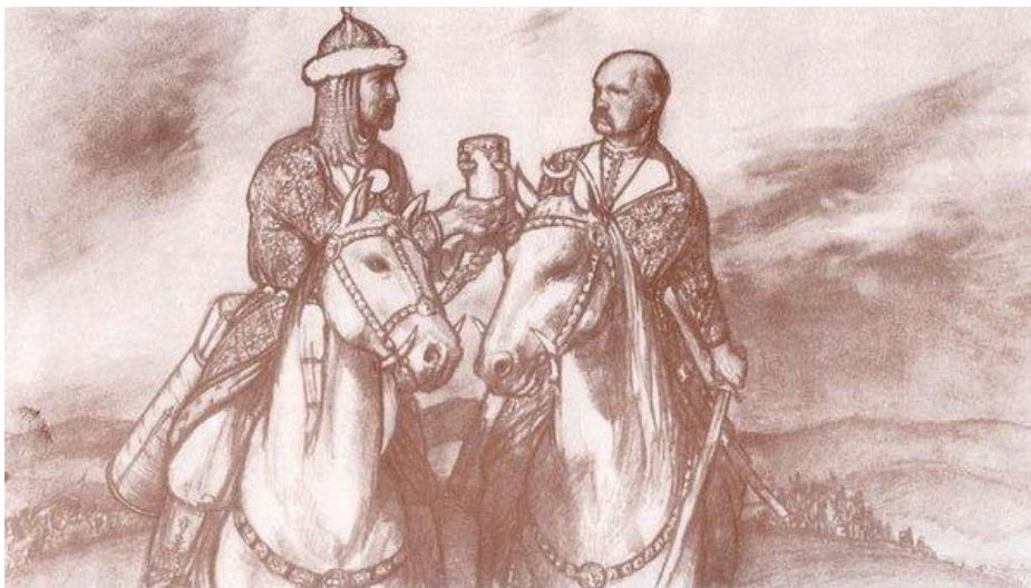
László Gyula: Árpád és a székelyek küldötte

Árpád nagyfejedelem Kr.u. 908-ban, életének 60. évében hunyta le szemét örökre!